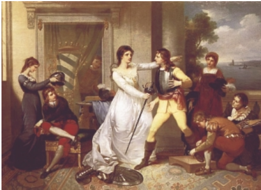
Dona Filipa de Vilhena, Condessa de Atouguia, armando seus filhos, em 1640.

Mas porque tal é de grande interesse para muitos curiosos sobre a família Távora, vejamos então a genealogia dos supliciados de 1759, que foram: Dom José de Mascarenhas da Silva e Lancastre, 8º Duque de Aveiro ; Francisco de Assis de Távora, 3º Conde de Alvor , a mulher deste, D. Leonor de Távora, 3ª Marquesa de Távora , e os seus filhos, Luís Bernardo de Távora, 4º Marquês de Távora , e José Maria de Távora; e o cunhado destes, o 11º Conde de Atouguia, Dom Jerónimo de Ataíde, descendente da famosa D. Filipa de Vilhena, que armou seus filhos no dia da aclamação d'El-Rei Dom João IV.