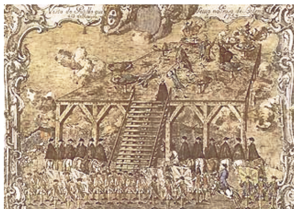
O suplício dos Távoras

A 13 de Janeiro do ano de 1759, foram executados, num descampado onde fica actualmente a praça Afonso de Albuquerque, em Belém, seis membros da mais alta nobreza portuguesa, na sequência daquele que ficou conhecido como “Processo dos Távoras”.